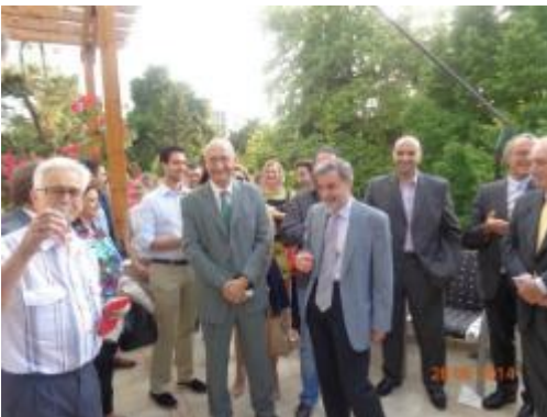
Au jardin de la résidence