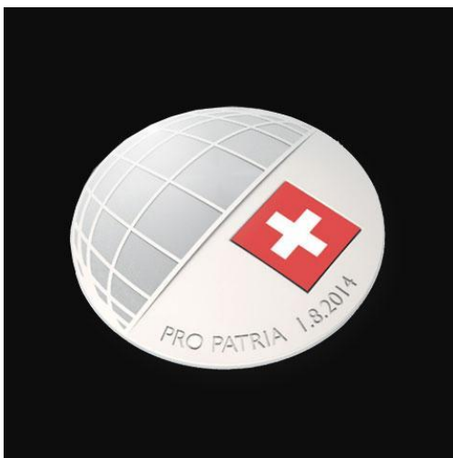
Das diesjährige 1. August-Abzeichen

Die Stiftung „PRO PATRIA Schweizerische Bundesfeierspende“ bezweckt, zum Gedenken an die Gründung der Schweizerischen Eidgenossenschaft, Sammlungen zur Förderung schweizerischer kultureller und sozialer Werke durchzuführen. Die Sammlungsergebnisse von jährlich rund drei Millionen Franken ergeben sich aus dem Erlös im In- und Ausland des traditionsreichen 1. August-Abzeichens und aus dem Verkauf der begehrten Pro Patria-Briefmarken. Das 1. August-Abzeichen ist 2014 der Fünften Schweiz gewidmet. Die darauf abgebildete Weltkarte steht für die Präsenz der Schweizer Mitbürger auf der gesamten Erde. Ein Teil des Erlöses der Pro Patria-Sammlung 2014 ist für die Schweizer Jugend im Ausland bestimmt.